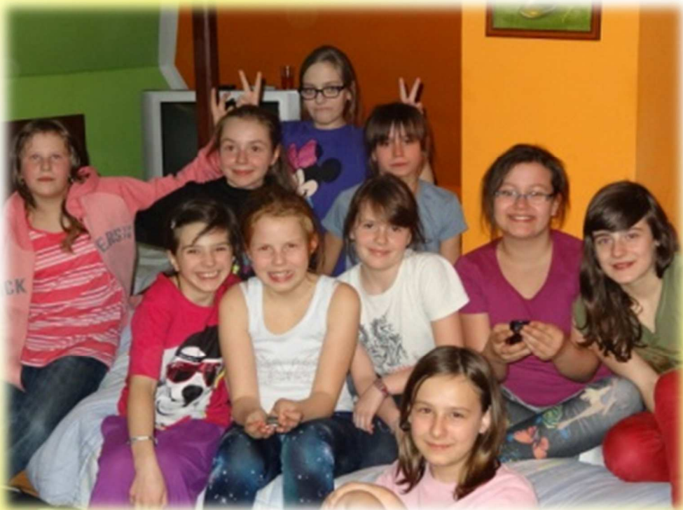
Jak dobrze być razem...