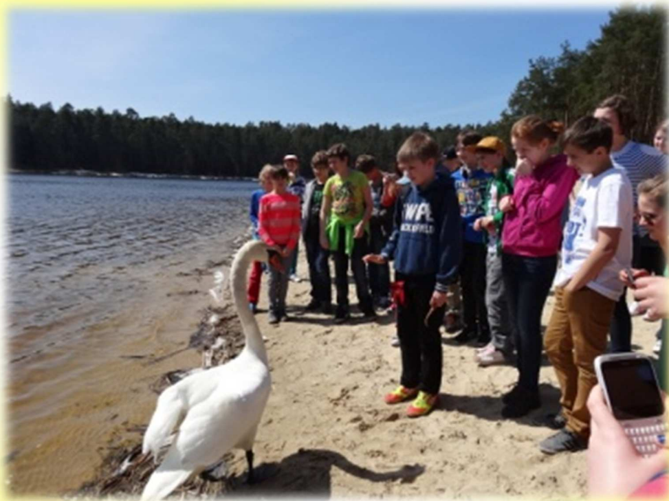
Spotkanie z łabędziem