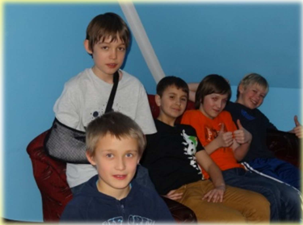
Chwila odpoczynku w pokoiku na tapczaniku