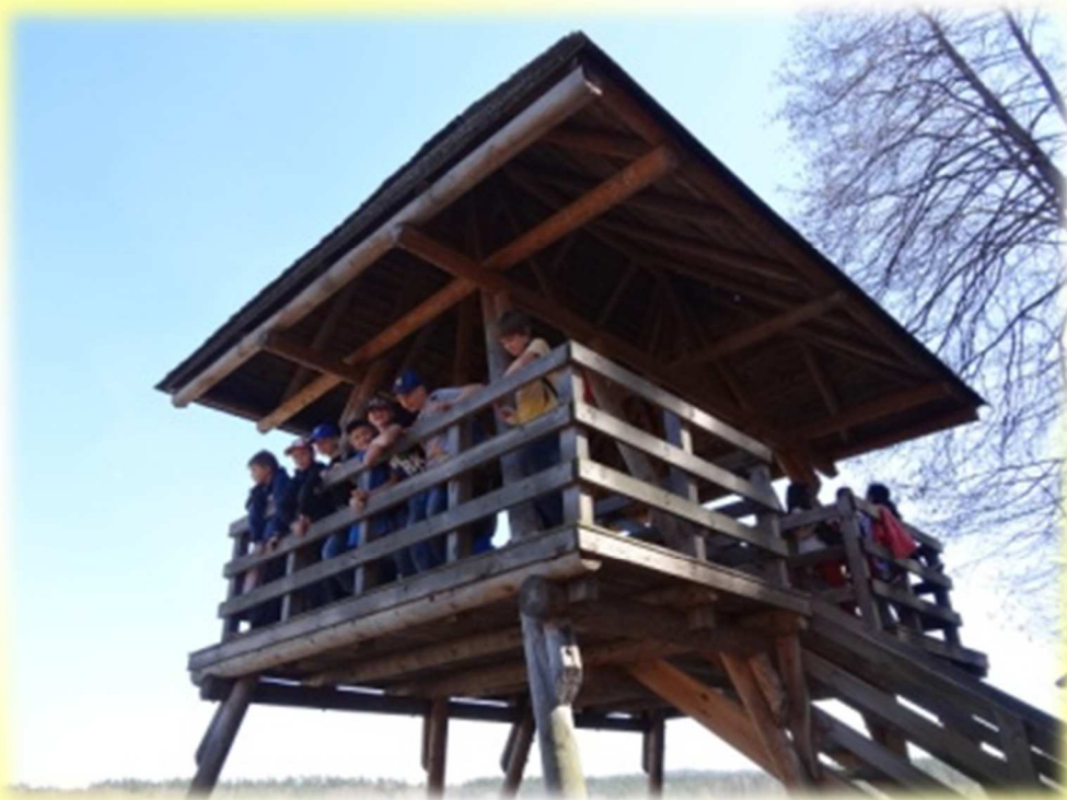
Z tarasu widokowego bezskutecznie wypatrywaliśmy koników polskich