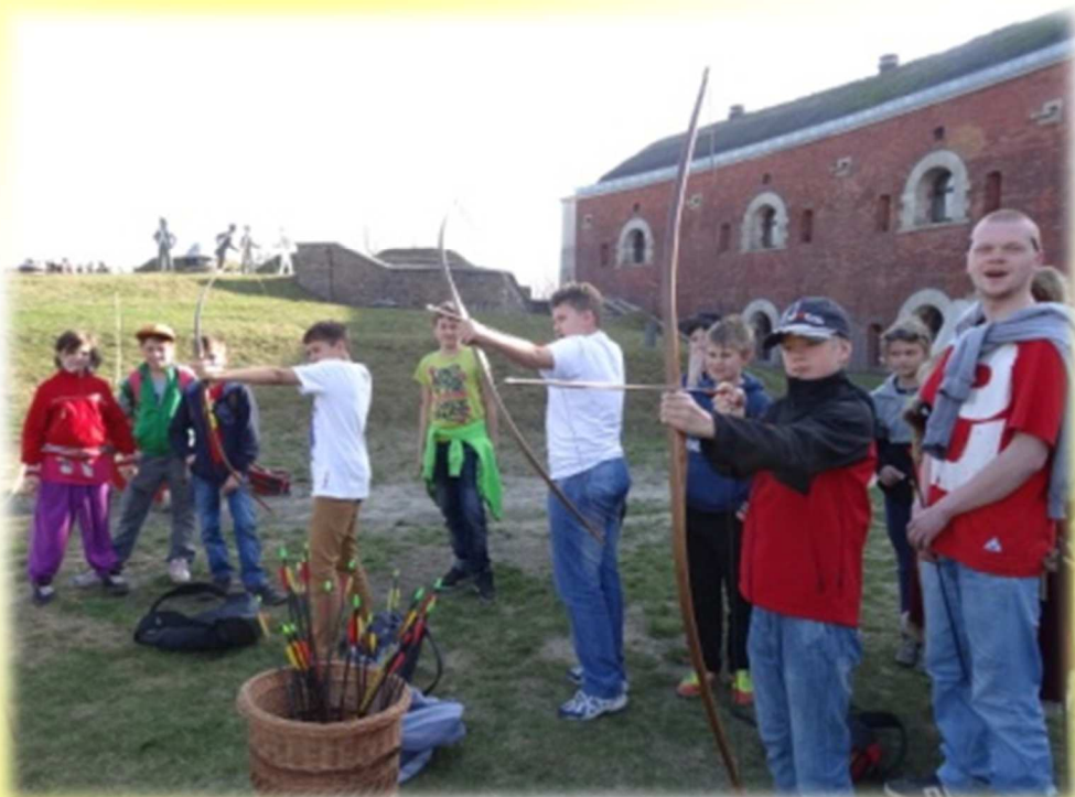
Twierdza w Zamościu i strzelanie z łuku