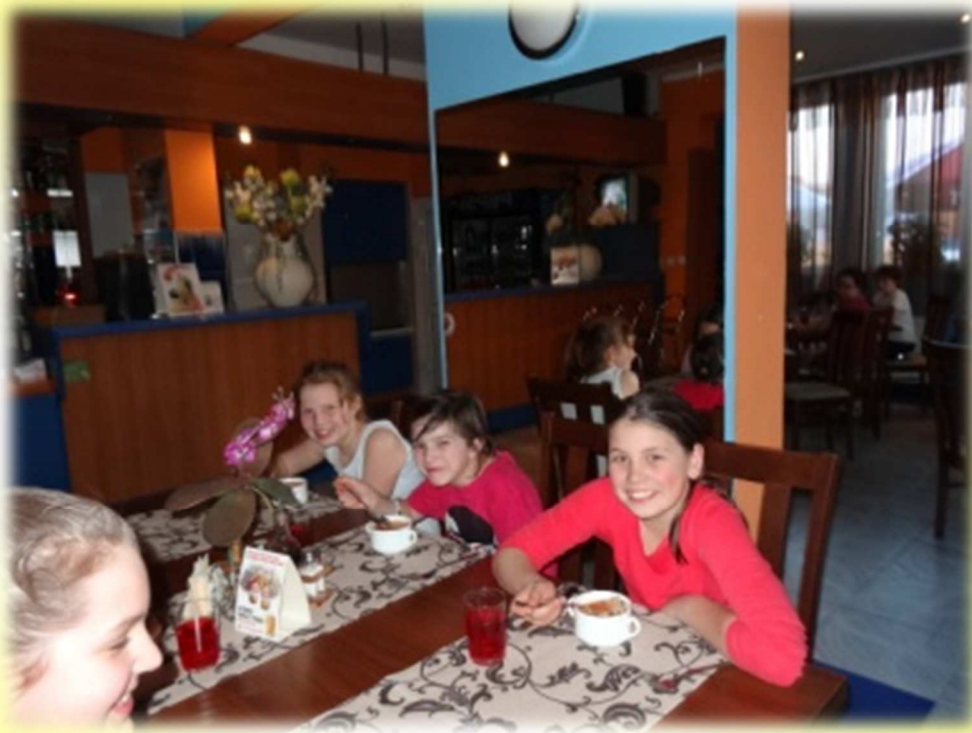
Pyszna obiadowokolacja dodała nam energii