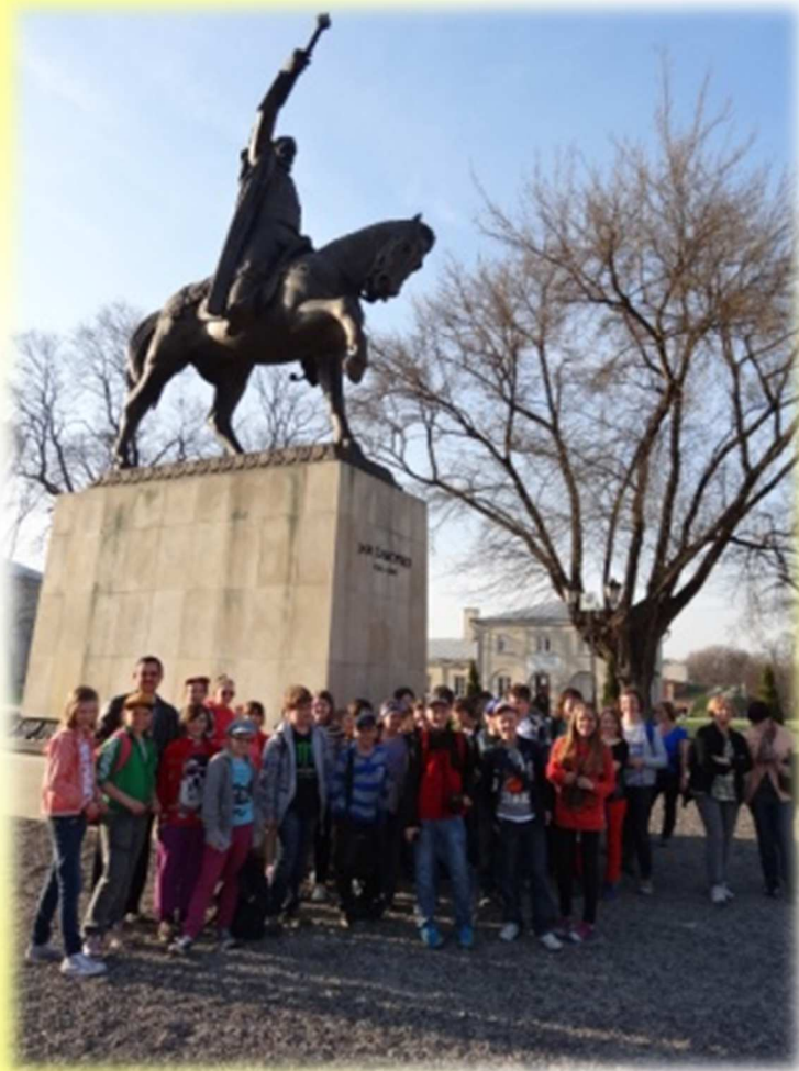
Przed pomnikiem Jan Zamojskiego