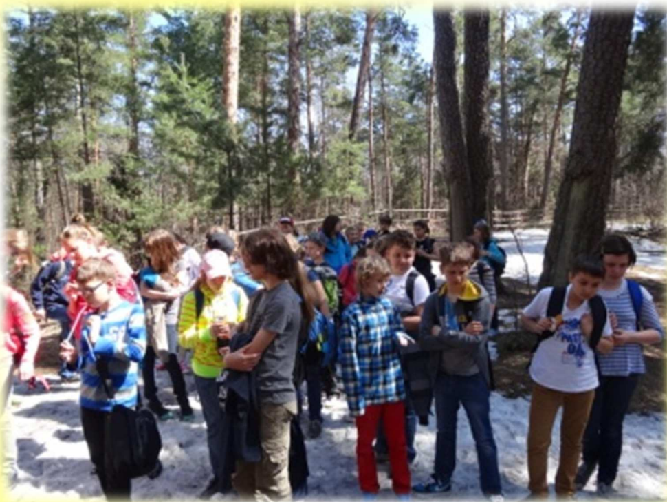
Śnieg pod nogami, błękit nieba nad nami