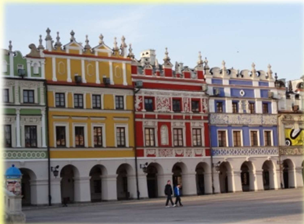
Kamieniczki na rynku w Zamościu