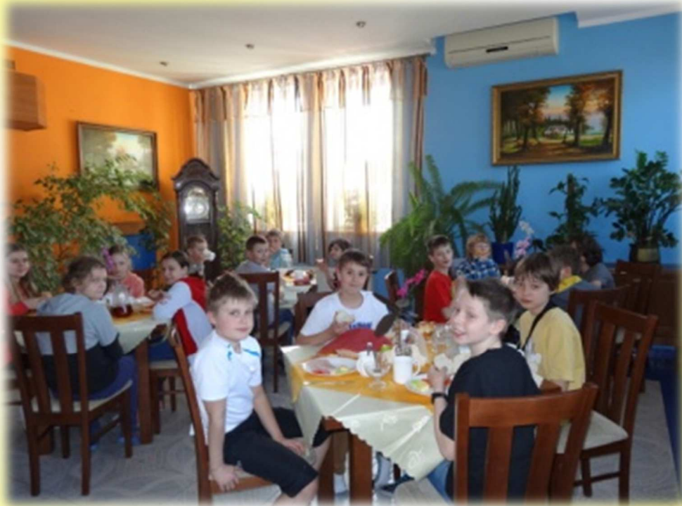
Smaczne śniadanie na dobry początek dnia