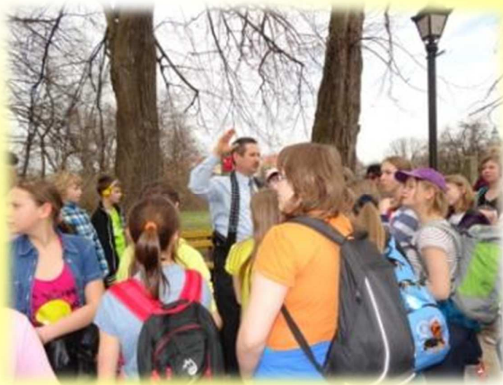
Pan przewodnik opowiadał o historii Sandomierza