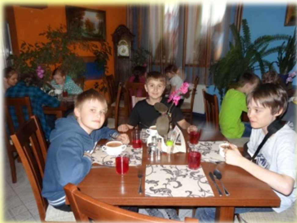
O czym oni myślą, jedząc zupę pomidorową?