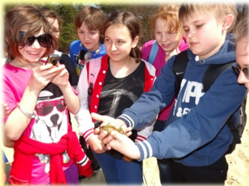
Ale śliczna żabka